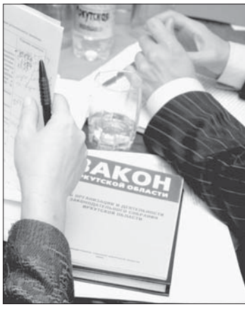
В отличие от Закона «О выборах депутатов Законодательного собрания...» поправки в Закон «Об организации и деятельности...» не вызвали больших споров

Инициативы «единороссов» касались существенной корректировки важнейших норм закона, регламентирующих свои процедуру выборов. Они настаивали на увеличении