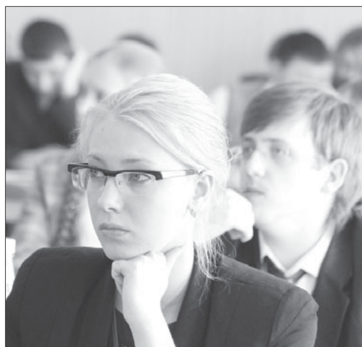
Исследовательский интерес к выборам проявили сотни студентов и аспирантов из более чем двадцати вузов

Наибольшее количество участников привлекла секция «Правовое качество избирательного законодательства России: проблемы и перспективы совершенствования». Здесь прозвучало более двадцати докладов. Они касались финансирования избирательных кампаний кандидатов и политических партий, реализации избирательных