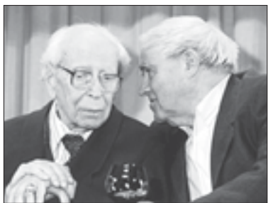
Дмитрий Лихачев и Даниила Гранин. Начало 90-х