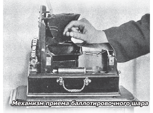
Механизм приема баллотировочного шара