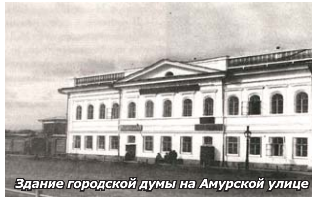
Здание городской думы на Амурской улице

Газета «Сибирь» написала: «После четырёх несостоявшихся заседаний Иркутская городская дума собралась, наконец, в достаточном числе гласных. К концу беседы о бараках оказалось, что гласные потихоньку разбрелись, и нашему думскому Михеичу оставалось вручить последнему оратору ключ от залы со словами: «Кончите, так замкните»... Таким образом газета пеняла на плохую явку гласных на думские заседания, из-за чего многие вопросы городского обустройства вовремя не решались. Обычно отсутствовала купеческая часть думы. Особенно это было заметно в период наиболее активной торговли.