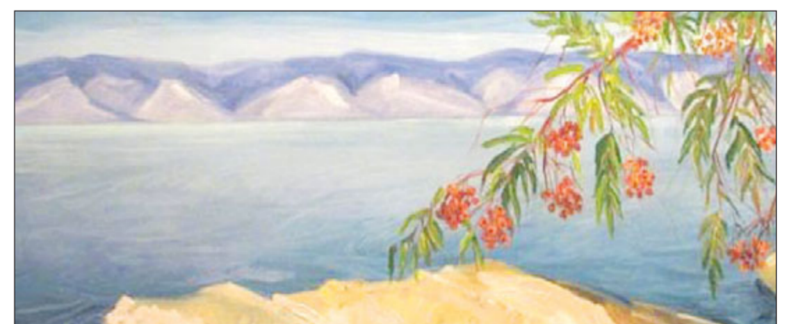
Байкал кисти Виктора Мироненко