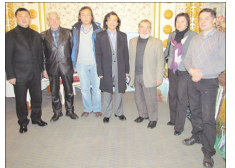
Фото на память: иркутская делегация в Харбине