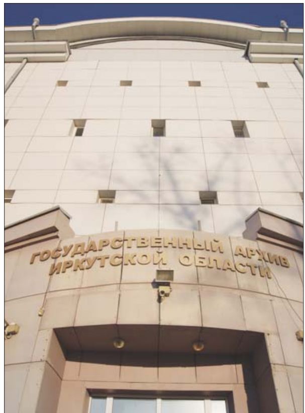
Фоторепортаж из Государственного архива Иркутской области на стр. 6