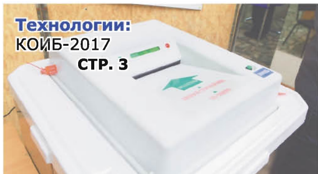
Технологии: КОИБ-2017 СТР. 3

Гость номера: историк о революции СТР. 4