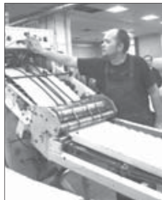
Объёмы работ очень большие, поэтому рука печатника всегда «на пульсе» станка

Чтобы отпечатать избирательные бюллетени потребовалось двое суток и 250 километров бумаги. Аукцион на изготовление избирательных бюллетеней для голосования на выборах депутатов Государственной Думы выиграла типография ОАО НПО «Облашинформ».