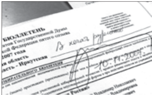
Подпись - руководство к действию