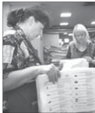
Первыми избирательные бюллетени пересчитывают работники типографий, а уже после них - члены избирательных комиссий