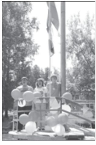
На фото — открытие областного фестиваля молодых избирателей в июле 2008 года. В этом году фестиваль будет проходить в третий раз, а его многочисленные мероприятия дополнят занятия по учебной программе «Школа молодого избирателя».