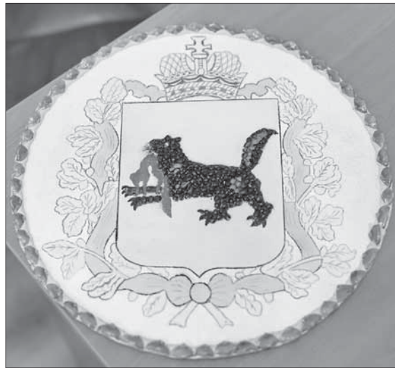
Начало на стр. 1

По данным на 30 июля, в избиркомы региона документы о выдвижении подали 177 кандидатов в главы и мэры территорий и 1495 кандидатов в депутаты местных дум. О желани участвовать в выборах мэра Боханского района заявили 4 кандидата (три – самовыдви-