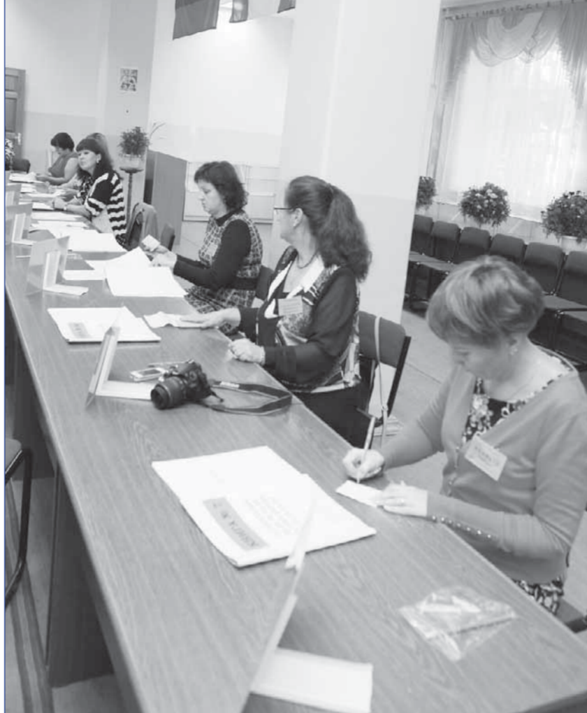
Начало на стр. 1

Явка избирателей в первом туре губернаторских выборов составила 29,19%. Лидером оказался Сергей Ерошенко, набравший 49,6% голосов избирателей (270526 человек); на втором месте - Сергей Левченко, 36,61%, (199702 человека); на третьем месте - Лариса Егорова, 6,76% (36872); на четвертом - Олег Кузнецов, 4,15% (22626 человек).