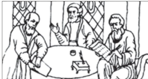
Нравственный облик кандидата прописывался в специальных наказах

Личные достоинства избираемого включали не только характеристики нравственного порядка. В эту же группу мож-