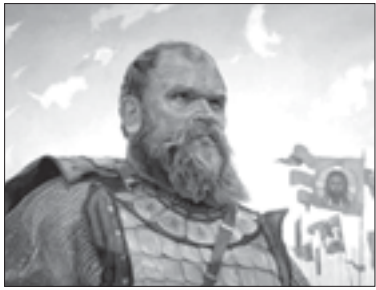
Основная работа по проведению общеземских выборов ложилась на воевод

В местных выборах приказ играл не только роль регистрирующего органа. В нем отсели-