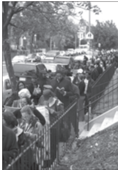
Америка голосует: люди занимали очереди к избирательным участкам с четырех часов утра

Во внешней политике демократы в ходе предвыборных выступлений говорили о выводе американских войск из Ирака. Скорее всего, Обама постарается завершить переговоры о степени американского военного присутствия в Ираке в течение двух лет, если позволит обстановка с безопасностью. В Афганистане ожидается расширение антитеррористической операции. Сами выборы, по мнению наблюдателей ОБСЕ, «продемонстрировали неотъемлемые принципы плюралистической демократии», «характеризовались транспарентностью и уважением к фундаментальным свободам и верховенству закона». В то же время некоторые проблемы были не в полной мере решены в отдельных штатах, сообщает ИТАР-ТАСС.