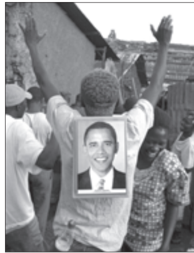
Африка ликует: кенийцы празднуют победу Барака Обамы на президентских выборах в США. Барак Обама для многих кенийцев является настоящим героем, бросившим вызов чуждым в нем всему человечеству. В честь него здесь называют детей, ему посвящают песни и молитвы