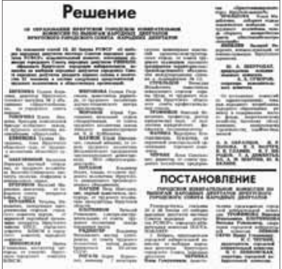
«Восточно-Сибирская правда» от 18 ноября 1989 года