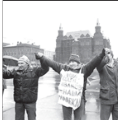
Впереди Съезд народных депутатов

«В СРЕДЕ ПАРТИЙНОЙ И СОВЕТСКОЙ БЮРОКРАТИИ ГОСПОДСТВОВАЛО УБЕЖДЕНИЕ, ЧТО ДЛЯ АЛЬТЕРНАТИВНОСТИ ВЫБОРОВ ДОСТАТОЧНО ИМЕТЬ ДВУХ КАНДИДАТОВ НА ОДИН МАНДАТ, А ОСТАЛЬНЫЕ — «ЛИШНИЕ».