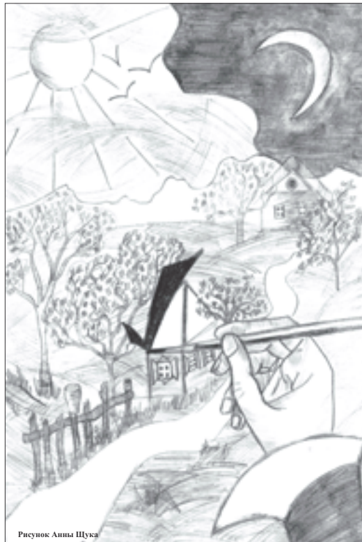
Рисунок Анны Шука

К сожалению, процесс фальсификации подписей кандидата Касьяновым, судя по всему, носил массовый характер. Причем, в ряде случаев он носил демонстративный характер. Наиболее яркий пример случился при проверке подписей, собранных в Твери. В Твери до революции служил губернатором известный писатель Салтыков-Щедрин и написал там повесть «История одного города» – острую сатиру на Российскую Империю. В Твери сборщики подписей вписали в листы фамилии героев этой повести. Поскольку наша выборка случайная, мы обнаружили двоек: Брудского и Фердыщенко. Естественно, проверка показала, что таких граждан в Твери нет. То есть люди, которые собирали подписи в поддержку кандидата Касьянова, просто издевались над ним. Это плохая работа штаба.