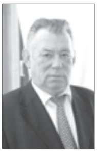
Отвечает член ЦИК России Геннадий Райков

КАКИЕ меры принимаются по обеспечению безопасности в день голосования на избирательных участках?