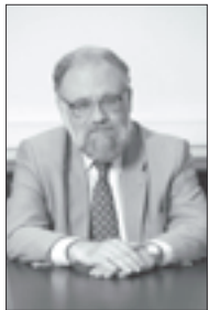
Отвечает председатель ЦИК России Владимир Чуров

МОЖНО ли собрать два миллиона подписей в поддержку кандидата всего за 30 дней, половина из которых – праздничные?