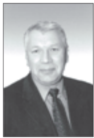
Отвечает член ЦИК России Валерий Крюков

ЧТО нового появилось в Государственной автоматизированной системе по сравнению с выборами в Госдуму?