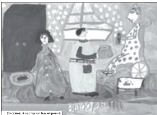
Рисунок Анастасия Басмуровой

дентских выборов к каждому избирательному участку будет прикреплено по три милиционера. Также стоит отметить группу по оперативному реагированию и обеспечению порядка внутри зон безопасности, о которых я уже говорила. Такие меры защиты предприняты для того, чтобы обеспечить спокойное проведение выборов. Ведь все мы понимаем, что жизнь и безопасность избирателей гораздо важнее результата выборов.