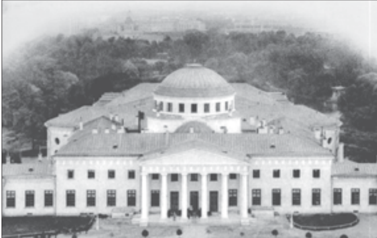
Таврический дворец – резиденция Государственной Думы в 1906–1917 годах

Лишь 12 молодых депутатов могли похвастаться высшим (или