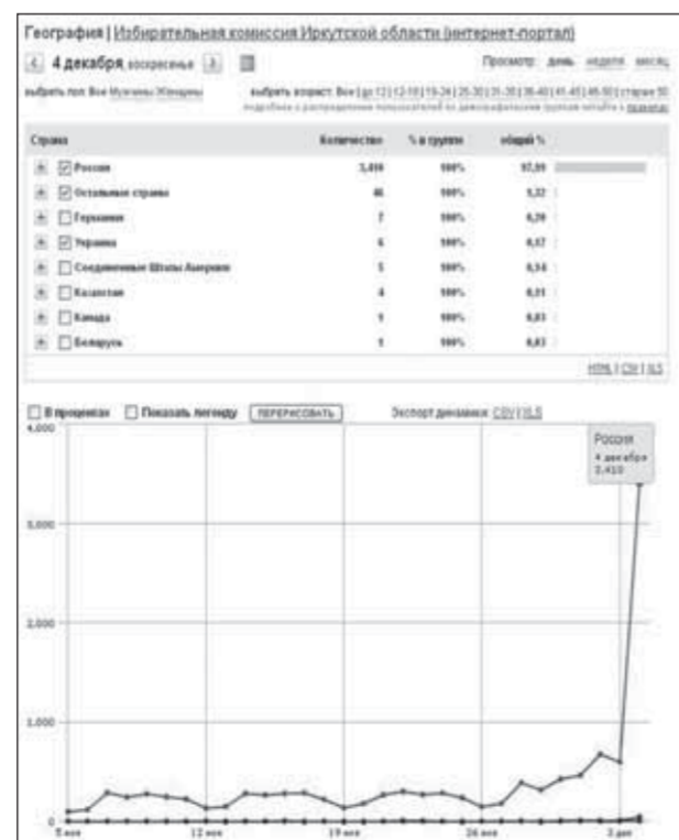
Рис. 1. География визитов на сайт 4 декабря 2011 года

Константин Баинов, консультант информационного центра аппарата Избирательной комиссии Иркутской области