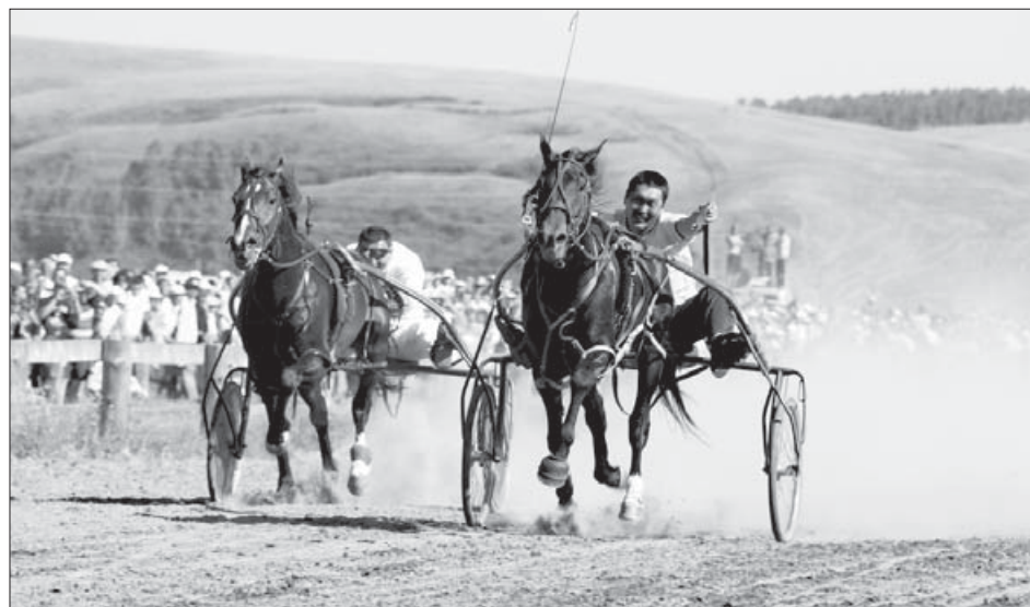
Конные скачки пользуются большой популярностью в Усть-Орде