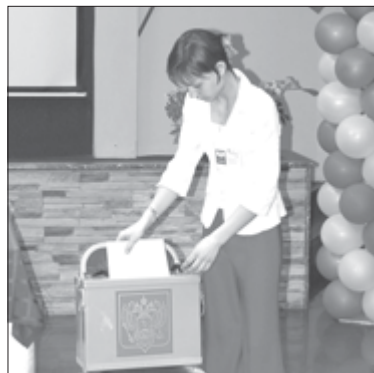
Одно из самых популярных обучающих мероприятий для молодых избирателей – деловая игра по выборам

Постоянно практикуем проведение Дней молодого избирателя. Они проходили в Новобирюсинске, Шиткино, Шелехово, Квитке и других крупных населенных пунктах. После живого диалога с главами поселений