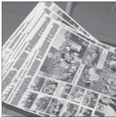
Молодёжь земли Тайшетской принимает самое активное участие в многочисленных мероприятиях по повышению правовой культуры избирателей, которые проводит территориальная избирательная комиссия Тайшетского района

– А за кем же будущее, как не за молодежью. Включились в первый этап областного фести-