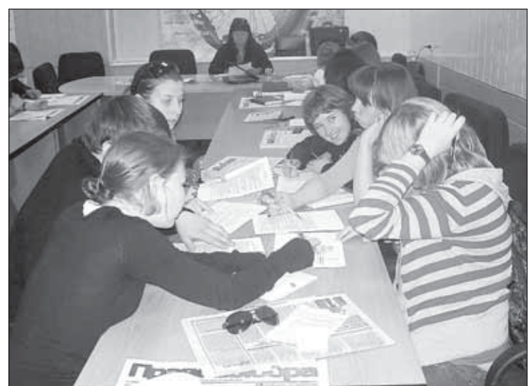
Слушатели молодежного центра правового обучения разгадывают кроссворд по выборам

Самым веселым получилось санекдотическое попури команды «Роза ветров» Иркутского государственного технического университета. Вы знаете главную народную примету