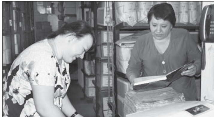
В архиве работают в основном женщины