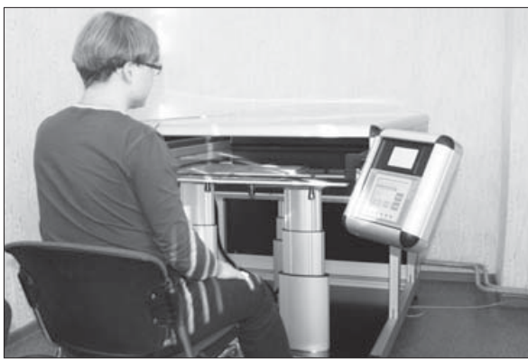
Старинные документы сканируются на современном оборудовании

Фоторепортаж Виталия Демидова из Государственного архива Иркутской области