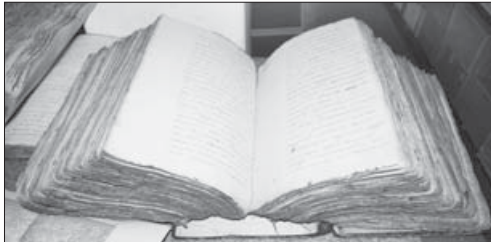
Эти документы еще предстоит отсканировать