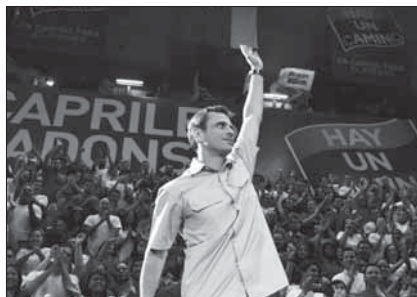
Главным слоганом Эрикке Каприлеса на выборах был: «Мадуро – ты не Чавес!»