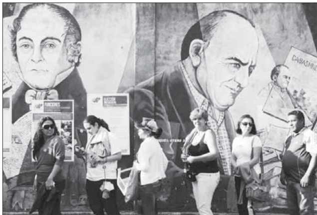
Венесуэльцы терпеливо ждали своей очереди проголосовать. В выборах приняли участие почти 15 миллионов граждан страны

ложение провести пересчет голосов, хотя и не ставит под сомнение результаты выборов. «Учитывая небольшой разрыв между кандидатами и тот факт, что мы живем в раско-