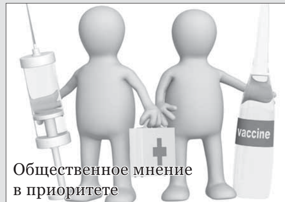
Общественное мнение в приоритете

В большинстве случаев палаты парламента, рассмотрев суть инициативы, выработывают свой вариант, и референдум по этой инициативе, что понятно, не проводится.