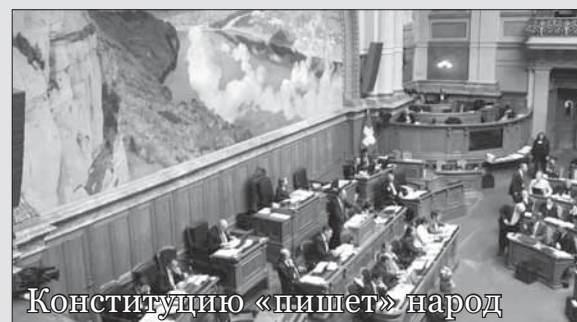
Конституцию «пишет» народ

Швейцарцы уже трижды в новейшей истории голосовали по вопросу отмены обязательного призыва. Каждый раз инициатором этого предложения выступала левая политическая организация «Группа «За Швейцарию без армии» («Gruppe für eine Schweiz ohne Armee» — «GSOA»). И каждый раз народ отвергал инициативу по отмене призыва, потому что избиратель все еще продолжает рассматривать армию как «несущий принцип» организации швейцарского общества.