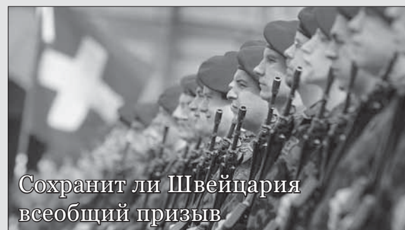
Сохранит ли Швейцария всеобщий призыв