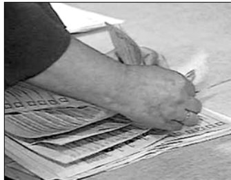
Когда итоги голосования подтасовывают, остается только одна надежда — на меч правосудия

умышленно допустил фальсификацию итогов голосования, неправильный подсчет голосов и завел неверное составление протокола об итогах голосования», — гласит приговор. Аккуратная и юридически безупречная формулировка. Именно ДОПУСТИЛ фальсификацию, ДОПУСТИЛ неправильный подсчет голосов, ДОПУСТИЛ завести неверное составление протокола. А кто это совершил?