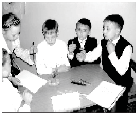
Ученики 4-го класса шелеховской гимназии «Малышок» соревнуются в знаниях на тему выборов

БИБЛИОТЕКИ Иркутска давно заняли свое место в работе с избирателями. Многие работники библиотек являются секретарями и членами избирательных комиссий различного уровня, ведут разъяснительную и просветительскую работу среди избирателей.