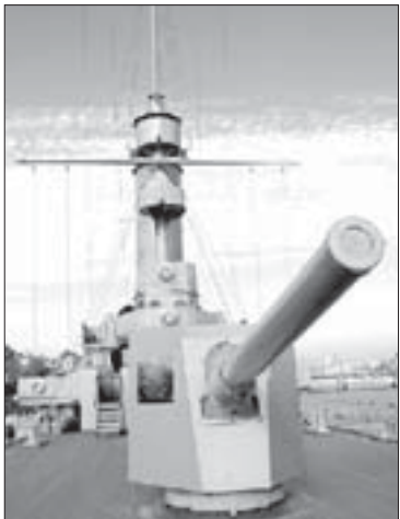
Орудие «Авроры», из которого был произведен холостой провокационный выстрел, ставший легендой сигналом к штурму Зимнего дворца

В Ночь с 25 на 26 октября по старому стилю 1917 года в Петербурге взяли штурмом Зимний дворец, в котором находилось Временное правительство. Крейсер «Аврора», полководец начал эту штурм холостым выстрелом, стал визитной карточкой Октябрьской революции. Однако эпохальным и блистательным это событие сделали кинорежиссеры. Историки до сих пор спорят, а был ли штурм? Но даже если и был, то выглядел он не так, как его представил Сергей Эйзенштейн в картине «Октябрь».