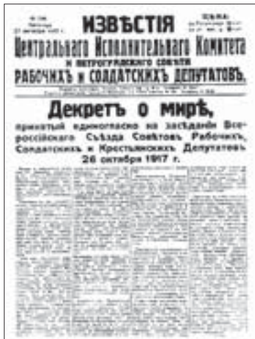
Декрет о мире стал первым среди знаменитых декретов (о мире, земле и печати), принятых большевиками в течение нескольких суток после событий 25 октября (7 ноября) 1917 года

Ночь на первое января всегда провоцирует размышления о том, каким станет год наступающий. Девяносто лет назад, когда начинался 1917-й, поводов для раздумий было множество. Если мы читаем в первые номера российских газет, вышедших 1 января 1917-го, то перед нашим взором возникнет былое в его незавершенности и непредсказуемости.