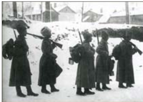
П.А. Оцуп. Заступая на позиции. 1917 г. РГАКФД

Некоторые реалии 1917-го памятливы нам по годам перестройки и кризисным 1990-м. Именно во время Первой мировой войны в Российской империи впервые возникли «Центрохраз», «Центроум» и другие «центры», получившие