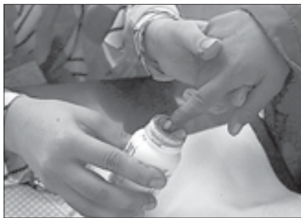
В некоторых странах на участках для голосования избиратели макают палец в чернила или другую краску. Делается это для того, чтобы человек не проголосовал дважды