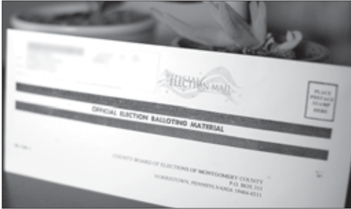
Почтовый конверт с избирательным бюллетенем. Проголосовать по почте могут граждане многих стран, в том числе и США