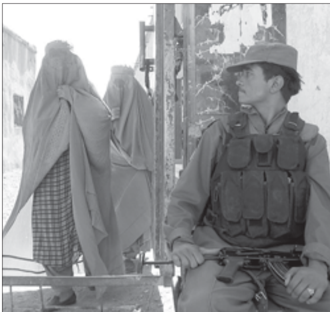
Переход от военной хунты к демократическому правлению обязательно сопровождается вооруженной охраной избирательных участков