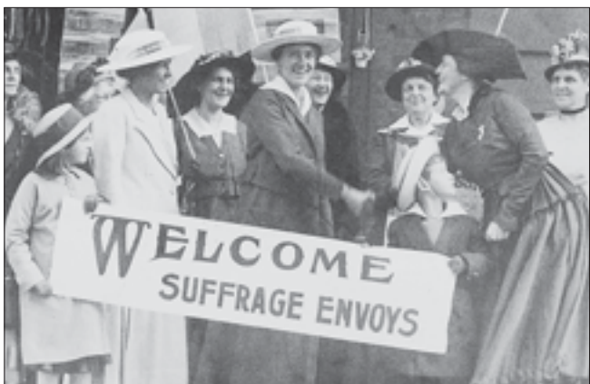
Суфражистки – участницы женского движения за предоставление женщинам избирательных прав. Движение получило распространение во второй половине XIX – начале XX века в США и Великобритании