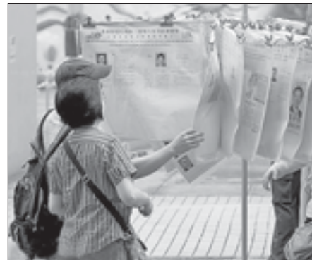
Стенд с информацией о кандидатах. Гонконг