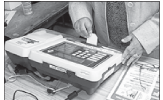
Аппарат для электронного голосования в США