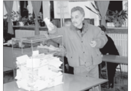
Прозрачные ящики для голосования применяются на выборах во многих странах мира. На фото Сербия