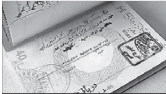
В Иране проголосовавшим избирателям ставили в паспорте специальный штамп