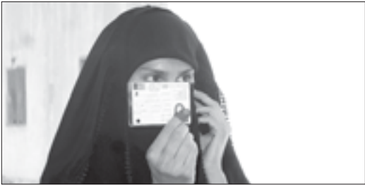
В странах Азии и Африки часто используются карточки избирателей, которые необходимо предъявить на избирательном участке. На фото Афганистан

В этом необычном репортаже мы подобрали фотографии, которые отражают особенности голосования в странах мира, не свойственные выборам в России. Одни фотофакты говорят о первых шагах в организации голосования, другие благодаря техническому прогрессу открывают новые возможности для голосования.