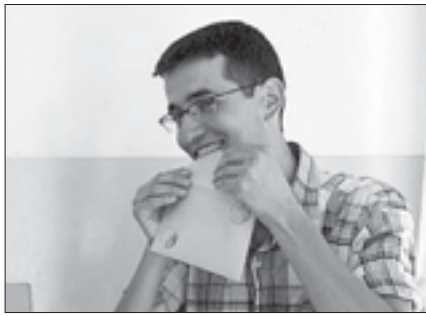
Заполненные избирательные бюллетени запечатывают в конверт и только потом бросают в ящик для голосования. Такая процедура чаще всего предусмотрена там, где используют прозрачные ящики