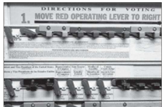
Ещё одна машина для голосования