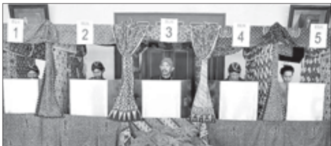
Это не магазин тканей, а избирательный участок в Индонезии