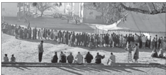
Длинные очереди – отличительная черта голосования в африканских государствах