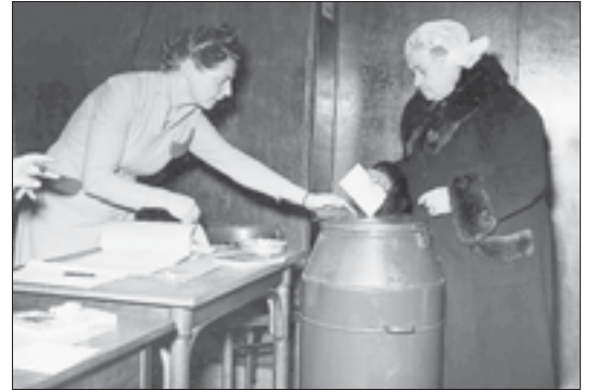
«Железобитонный» ящик для голосования. Нидерланды, 1950 год