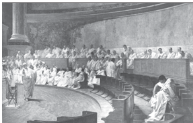
Марк Туллий Цицерон произносит речь против соперника Катилины, после чего Цицерон будет избран консулом Римской республики, обладающим высшей военной и гражданской властью в стране