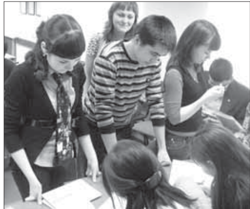
Практическое занятие для студентов: работа участковой избирательной комиссии в день голосования

В них участвовали старшеклассники и студенты. Воспитанники художественных школ были приглашены к участию в конкурсе рисунков на тему выборов. Заметными событиями для юных усть-илимцев стали мероприятия, посвященные февральскому Дню молодого избирателя, и городской этап областного фестиваля молодых избирателей «Будущее за молодежью!».