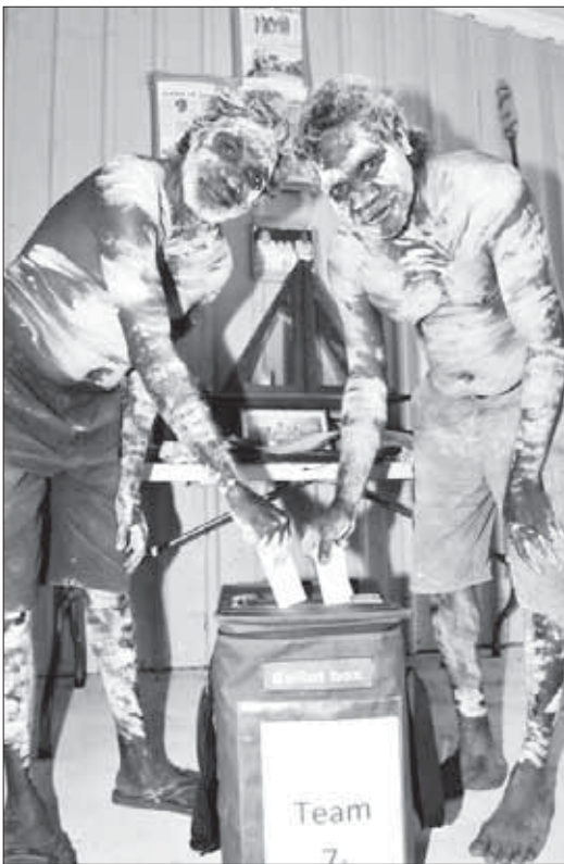
Аборигены получили право голосовать на выборах только в 1962 году