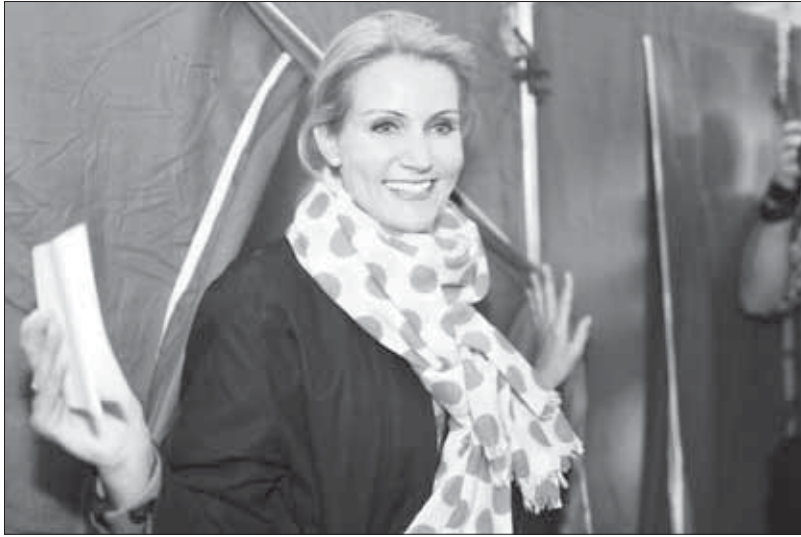
Выборы парламента Дании 15 сентября 2011 года. Лидер социал-демократов Хелле Торнинг-Шмитт на избирательном участке. Парламентские выборы принесли ей пост премьер-министра страны

Парламент Дании (Фолькетинг) в настоящее время состоит из 179 депутатов: 135 мандатов распределяются по многомандатным округам в регионах страны, 40 мандатов являются так называемыми дополнительными мандатами, два мандата имеют представители Фарерских островов и столько же — представители Гренландии.