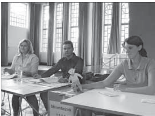
Избирательный участок: ящик для голосования установлен рядом с членами избирательной комиссии

Предусматривается и возможность получения открепительного удостоверения, в законе о выборах есть соответствующая норма: «Избиратели, не имеющие возможности проголосовать в том избирательном участке, в список которого они внесены, а также избиратели, по не зависящим от них причинам не внесенные в список избирателей, получают по их заявлению (запросу) открепительное удостоверение».