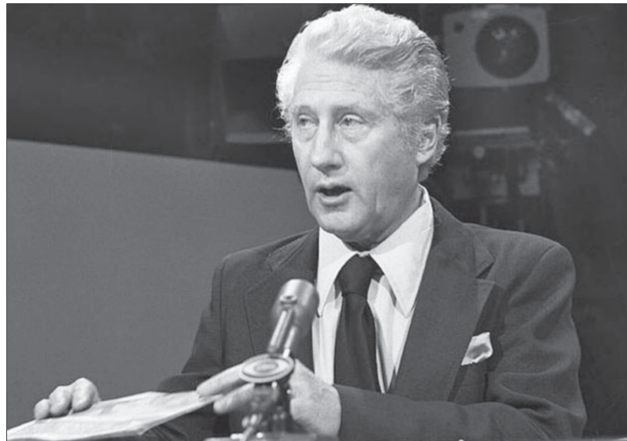
Разоблачительные статьи репортеров газеты «Вашингтон Пост» Боба Вудворда и Карла Бернштейна основывались на информации их тайного осведомителя, которого они назвали «Глубокой глоткой». В 2005 году стало известно, что под этой кличкой скрывался заместитель директора ФБР Марк Фелт (на снимке)

По материалам lenta.ru , gzt.ru , nixonlibrary.gov