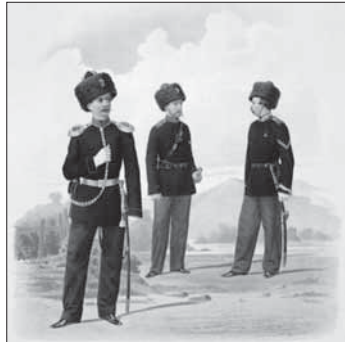
Пешие батальоны Забайкальского казачьего войска и Конные: Иркутский и Енисейский казачьи полки (парадная форма). 21 октября 1867 года