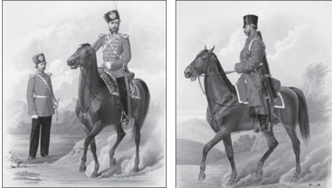
Рядовой и обер-офицер лейб-гвардии казачьего полка (городская парадная форма). 10 июля 1867 года