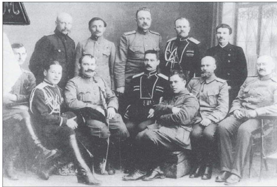
Атаман Семенов (внизу второй слева) с атаманом Сибирского войска Ивановым-Риновым

В этой атаке батальону противника спешенные наши шесть сотен нанесли решительное поражение: взято в плен до двухсот семидесяти нижних чинов