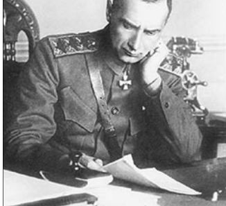
Колчак – Верховный правитель. Численность его армии весной 1919 года достигала 400 тысяч человек. Адмиралу удалось прогнать Восточный фронт Красной армии, но в результате скорого контрнаступления красные отбросили армию Верховного правителя далеко на восток. В январе 1920 года Колчак был арестован 7 февраля расстрелян большевиками

Адмирал организовал наступление. В марте был