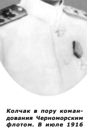
Колчак в пору командования Черноморским флотом. В июле 1916 года на линкоре «Императрица Мария» он участвовал в рейде русских кораблей в Черном море, завязав бой с турецким крейсером «Бреслау». Через месяц под руководством Колчака была усилена блокада Босфора и угольного района Эргели – Зонгулдак, произведено массированное минирование портов противника, в результате которого выходы неприятельских кораблей в Черное море почти прекратились

Осенью 1909 года ледокольные транспорты «Таймыр» и «Вайгак» отплыли из Кронштадта во Владивосток. Сюда эти составили экспедицию Северного Ледовитого океана, которой предстояло исследовать путь из Тихого океана в Ледовитый вдоль берегов Сибири. Колчак как командир ледокольного транспорта «Вайгак» пришел на нем летом 1910 года через Индийский океан во Владивосток, затем поплыл к Берингову проливу и в Чукотское море, где выполнял гидрологические и астрономические исследования.