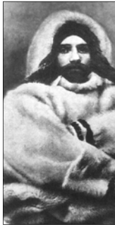
Колчак во время экспедиции по Северному Ледовитому океану. В 1902 году он с шестью соратниками на деревянном гиббонсе обследовал Ново-Сибирские острова, нашел последнюю стоянку Толля и установил, что тот погиб. Во время этой экспедиции Колчак тяжело заболел и едва не скончался от воспаления легких и цинги

Летом 1899 года Колчак назначен во внутреннее плавание на крейсер «Князь Пожарский». Колчак подает рапорт о переходе в Сибирский экипаж и вахтенным начальником бронированной «Полтавы» отправившись в Восток. Когда корабль прибыл в Пирей, лейтенант принял участие в экспедиции Петер-