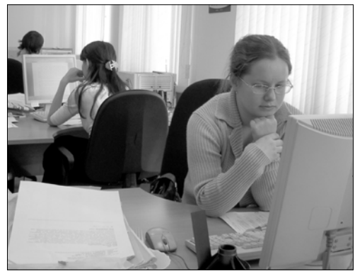
Сотрудники института за работой, которая включает в себя, в том числе, изучение новостей законодательства других субъектов Федерации

Экспертиза проводится не только с точки зрения определения соответствия или несоответствия заяв-