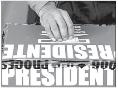
На президентских выборах 2006 года сеть ресторанов Мехико предложила 20-процентную скидку клиентам, которые покажут карточку избирателя с печатью о голосовании

В 2000 году Конгрессом была создана комиссия по вопросам реформирования избирательной системы. Комиссия предложила сделать день выборов праздником и совместить его с Днем ветерана 11 ноября, но принятый Конгрессом законопроект не включил в себя реформы. Сегодня конгрессмены активно работают над законопроектами и совершенствовании избирательных процедур. Граждане не менее активно обсуждают перспективы избирательной реформы. Выдвигают свои предложения, например, обязать государство выплачивать 100 долларов каждому, кто проголосовал на выборах. Однако самым популярным считается, что Конгресс, несмотря на все предложения, так ничего и не изменит.