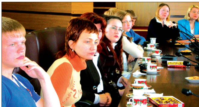
Участники конкурса после награждения за чашкой чая