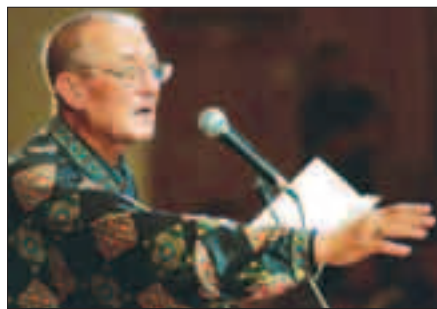
Поэт Евгений Евтушенко призвал иркутских писателей объединиться

Первый съезд писателей Приангарья пройдет в Ангарске