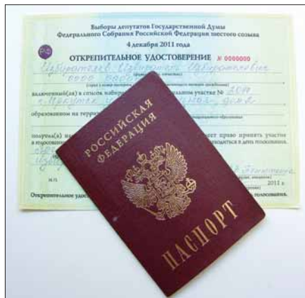
Для получения открепительного удостоверения необходимо предъявить паспорт

При получении необходимо расписаться в реестре выдачи открепительных удостоверений. В день голосования 4 декабря с открепительным удостоверением можно прийти на любой избирательный участок в стране и проголосовать. При себе необходимо иметь паспорт.