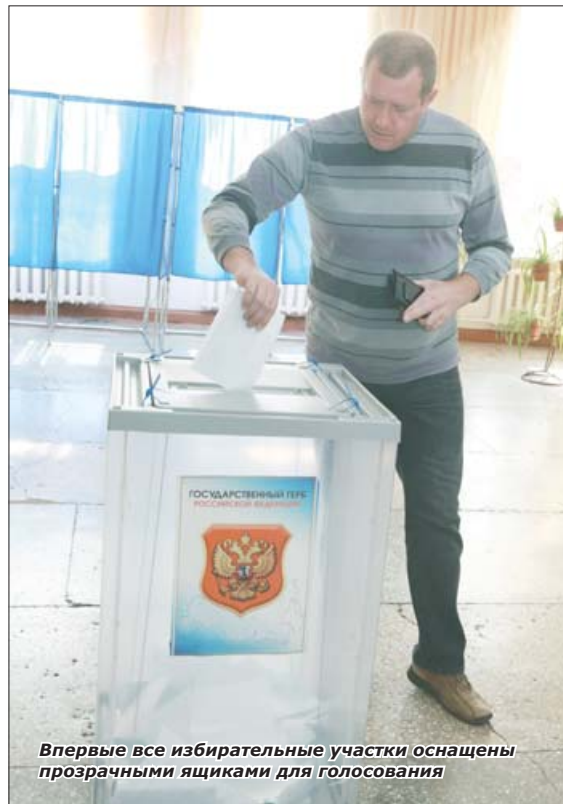
Впервые все избирательные участки оснащены прозрачными ящиками для голосования