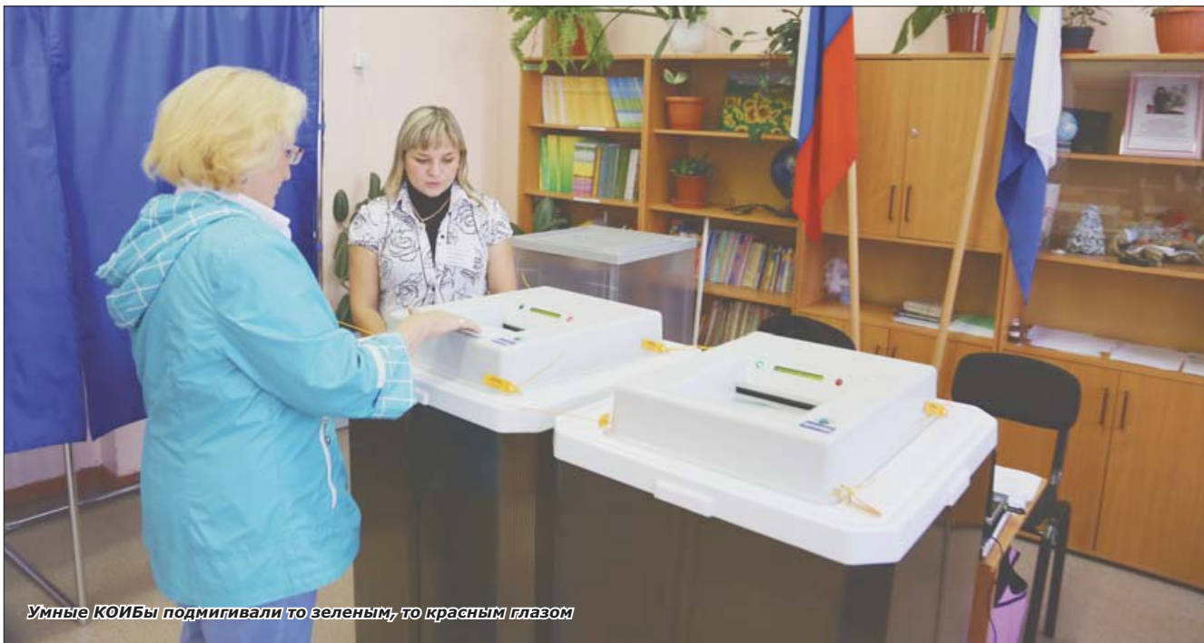
Умные КОИБы подмигивали то зеленым, то красным глазом