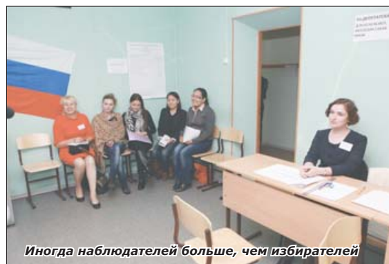
Иногда наблюдателей больше, чем избирателей