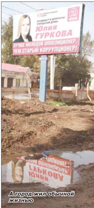
А город жил обычной жизнью