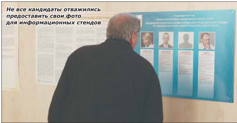
Не все кандидаты отважились представить свои фото для информационных стендов