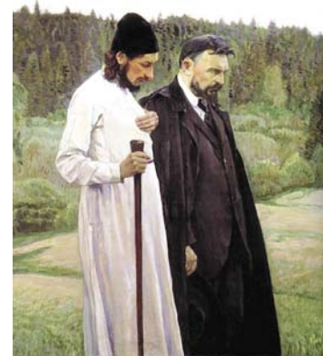
Философы П.А. Флоренский и С.Н. Булгаков. Картина художника Михаила Васильевича Несторова, Государственный Третьяковский галерея

– После революции многие уезжают, но Павел Флоренский остается и вполне успешно занимается в новую жизнь. Как это объясняется? – Дело в том, что о неизбежности перелома говорили многие. Деда полагают, что в развитии цивилизации падос Возрождения сменяется пафосом того, что называется Средневековьем. Он считал, что в XX веке наступило световое радостное Средневековье.