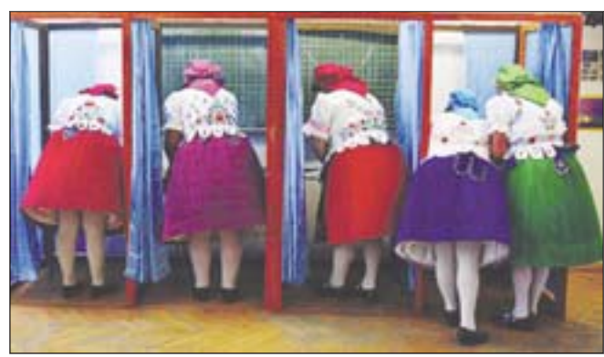
Венгерские избирательницы голосуют на выборах в Европарламент

КОГДА подсчитали бюллетени, стало ясно: европейские голоса – очень сильное заявление протеста против многого из того, что не нравится европейцам, особенно на фоне финансового кризиса. А не нравятся Европе больше всего правящие партии, социалисты, лево-центристы и широко открытые для иммигрантов двери Старого света.