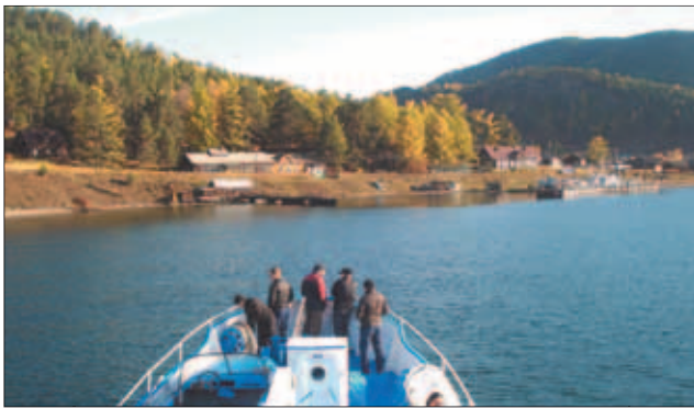
Прямо по борту – Большие Коты