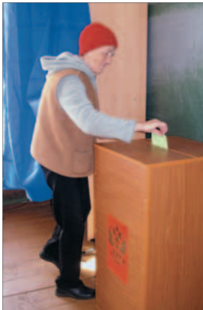
Избирательный участок в Больших Котах расположен в школе